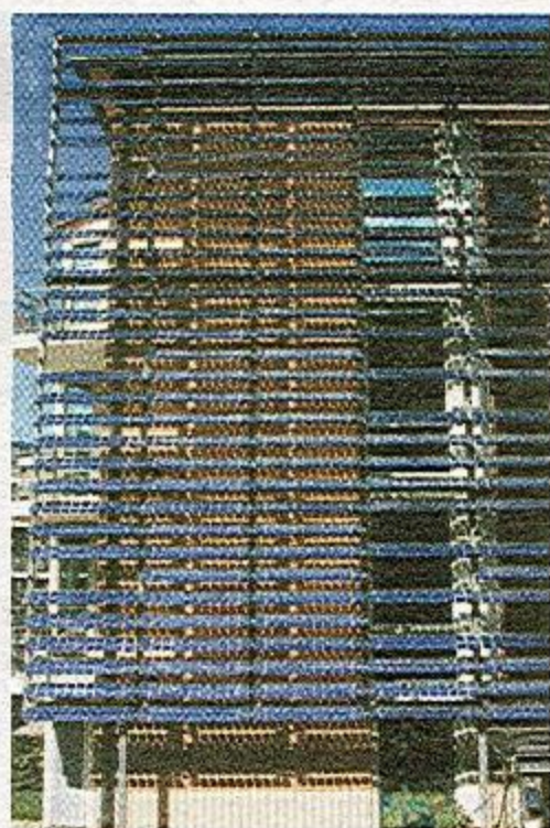
Solceller i Hammarby sjöstad.